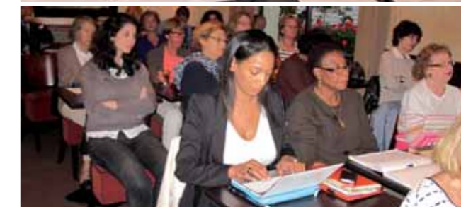
Une partie de la salle attentive à l'exposé de cette jeune femme.