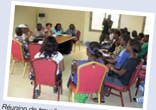
Réunion de travail.