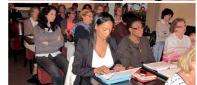
Une partie de la salle attentive à l'exposé de cette jeune femme.