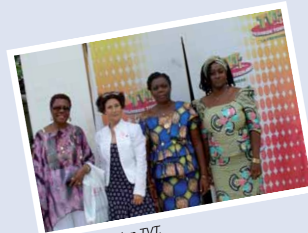
Arrivée à la station TVT.