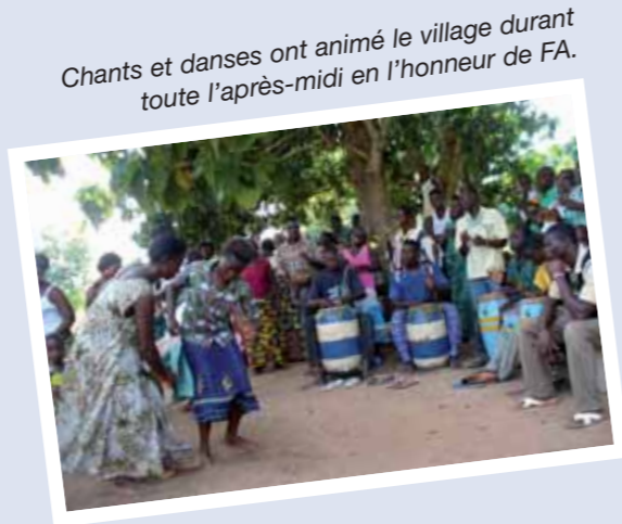
Chants et danses ont animé le village durant toute l'après-midi en l'honneur de FA.