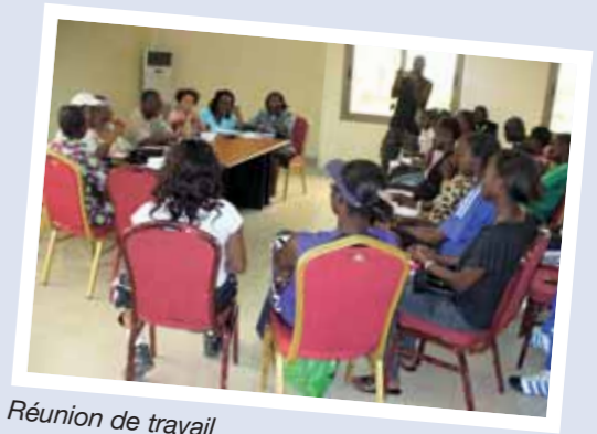
Réunion de travail.