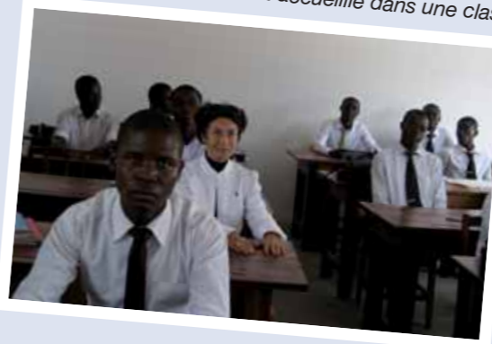
... une nouvelle élève est accueillie dans une classe.