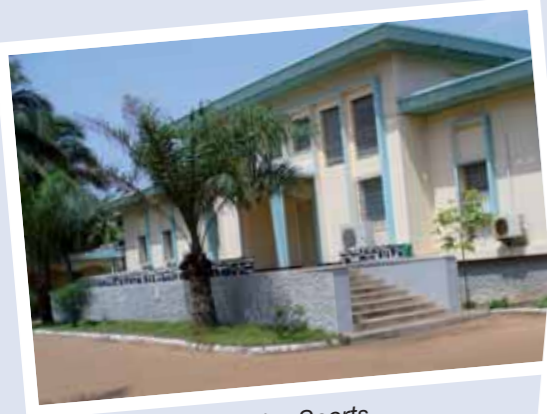
Arrivée au Ministère des Sports.