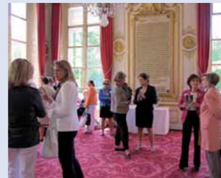
Une, bien belle journée qui devait se poursuivre dans les salons du Sénat pour une occasion spéciale.