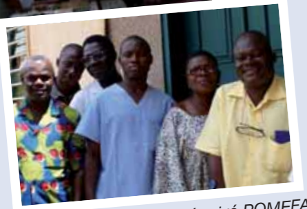
Visite du centre de santé privé POMEFA où sont offerts des services de qualité en planification familiale dirigé par une équipe très engagée autour de son directeur.