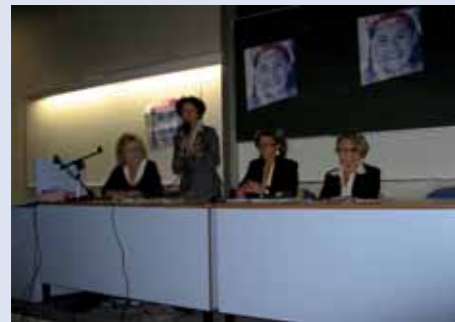
Ouverture de la séance plénière.