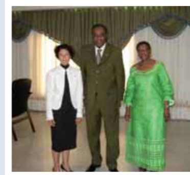
Visite de courtoisie à Edem KODJO, Ancien Premier Ministre, Consultant International et Président de PAX AFRICANA également Ambassadeur de la Paix pour l'Union Africaine.