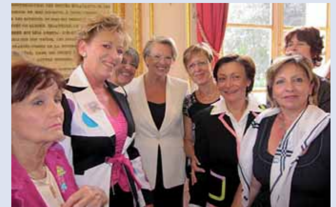
Femme Avenir Bordeaux, Mâcon, Marseille, Paris entourant Le Ministre.