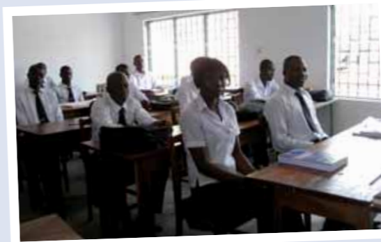
Photo de classe qui ne compte qu'une jeune fille...